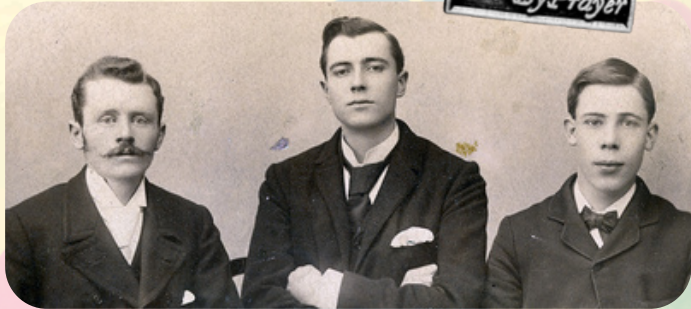
高文 (Walter Gowans)